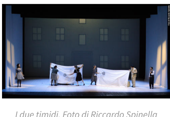
I due timidi.