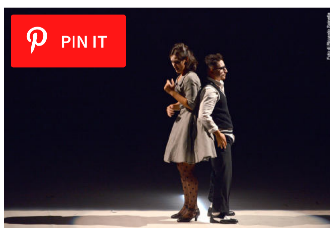
I due timidi.