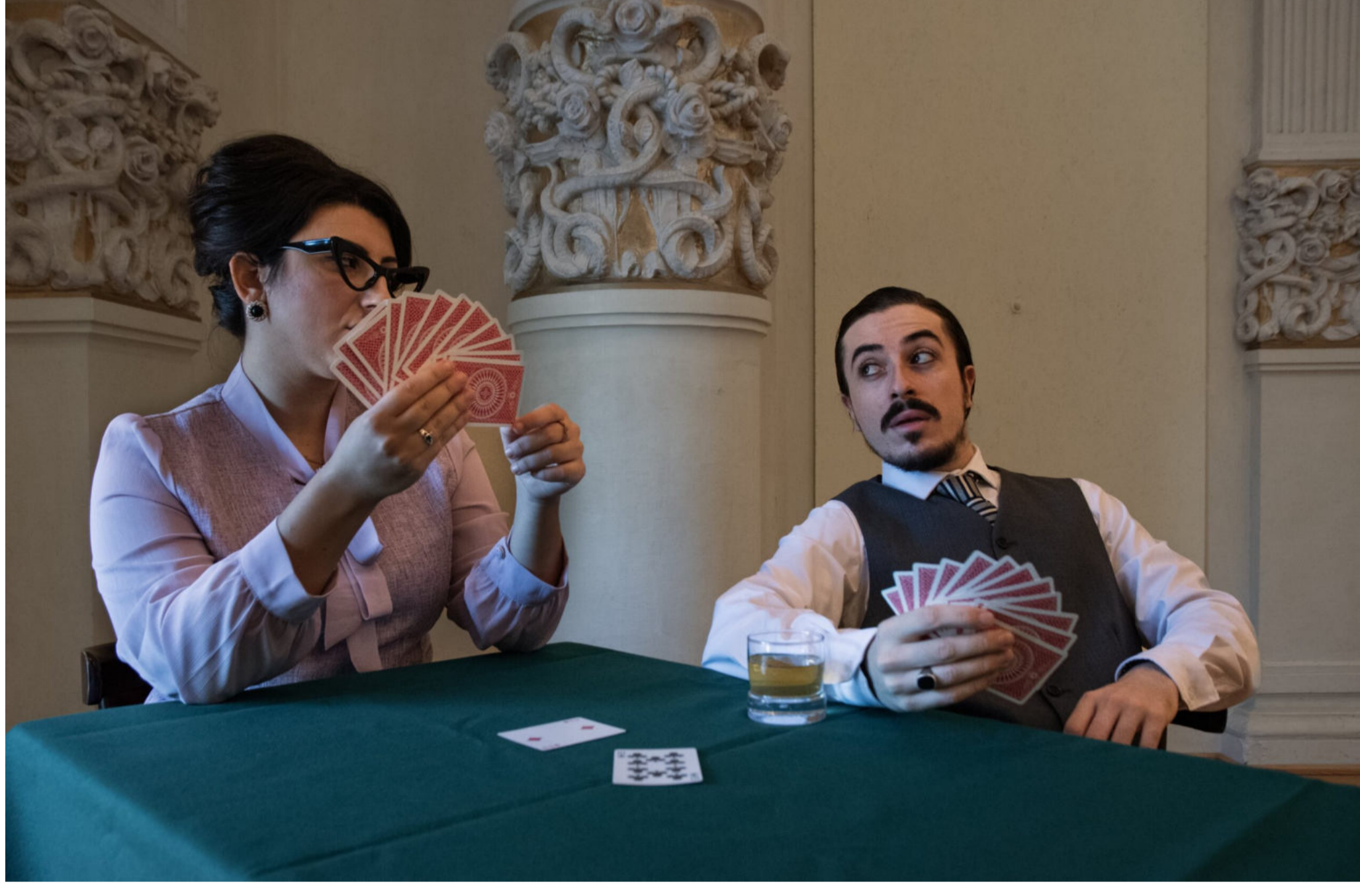
A Hand of Bridge.

L'apertura di A Hand of Bridge , composta da Barber su libretto di Gian Carlo Menotti e rappresentata per la prima volta nel 1959 proprio a Spoleto durante il Festival dei Due Mondi, è considerata l'opera più breve mai messa in scena. Le sequenze si svolgono infatti in soli dieci minuti, quando ognuno dei quattro borghesi seduti a un tavolo nel giocare una partita di bridge si astrae nei propri pensieri: una madre che non deve morire, piume di pavone attaccate ad un oggetto desiderato, costrizioni, mancanze d'amore; l'azione che sta per svolgersi si placa solo con un colpo di briscola mentre le due coppie, appese nelle loro vite, proseguono il gioco.