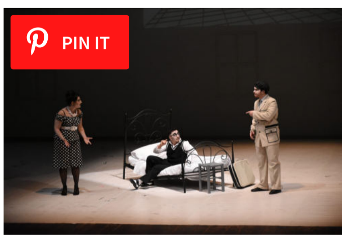
I due timidi.