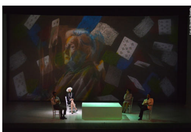
A Hand of Bridge.