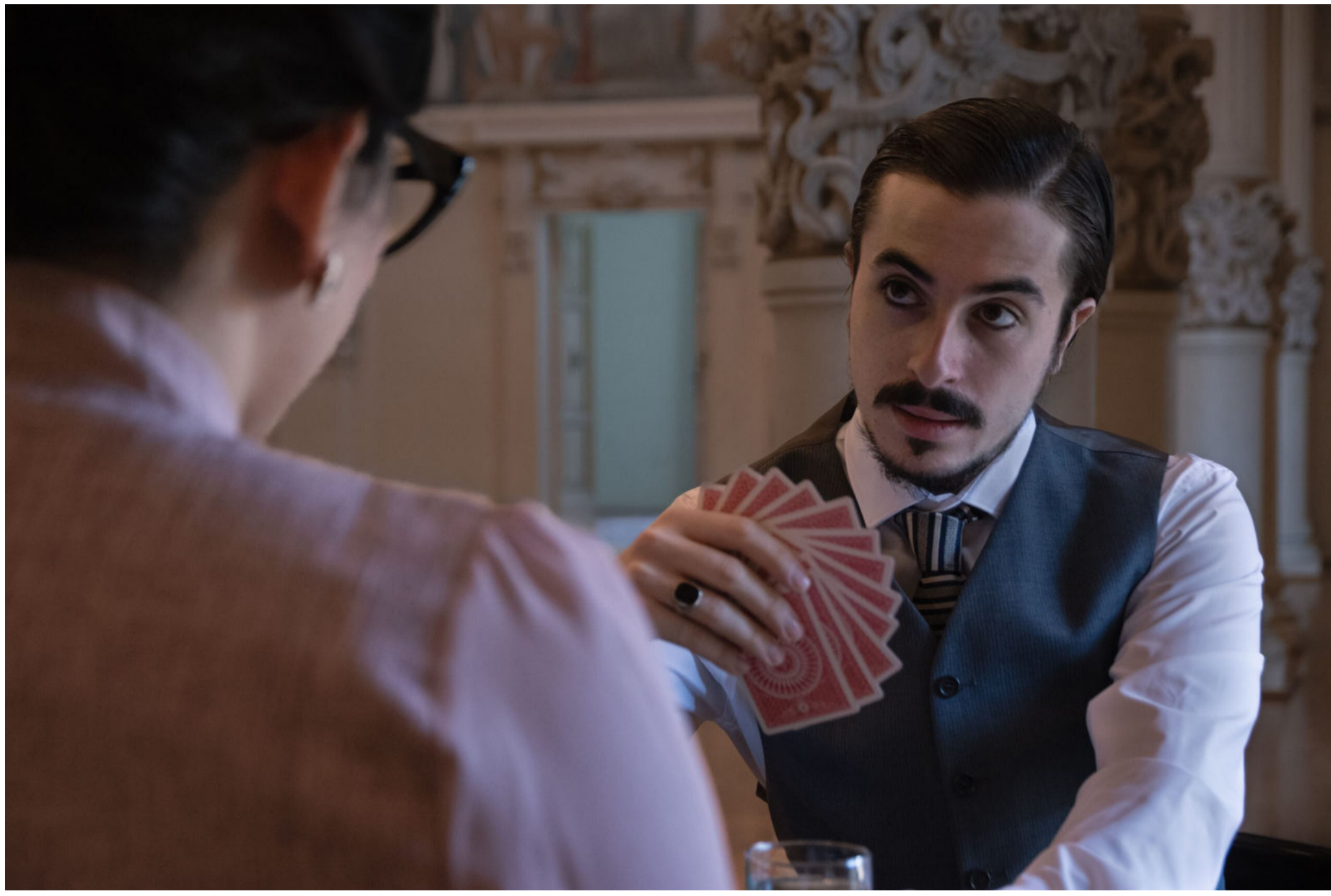
A Hand of Bridge.

Timidamente prosegue la 77ma stagione del Teatro Lirico Sperimentale di Spoleto che ieri sera al Teatro Nuovo ha visto in scena il dittico contemporaneo, composto da due opere firmate rispettivamente da Samuel Barber e Nino Rota e che, in una prima ben poco gremita ma entusiasta, ha presentato al pubblico A Hand of Bridge e I due timidi , sotto la direzione del maestro Gian Rosario Presutti.