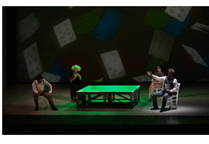
A Hand of Bridge.