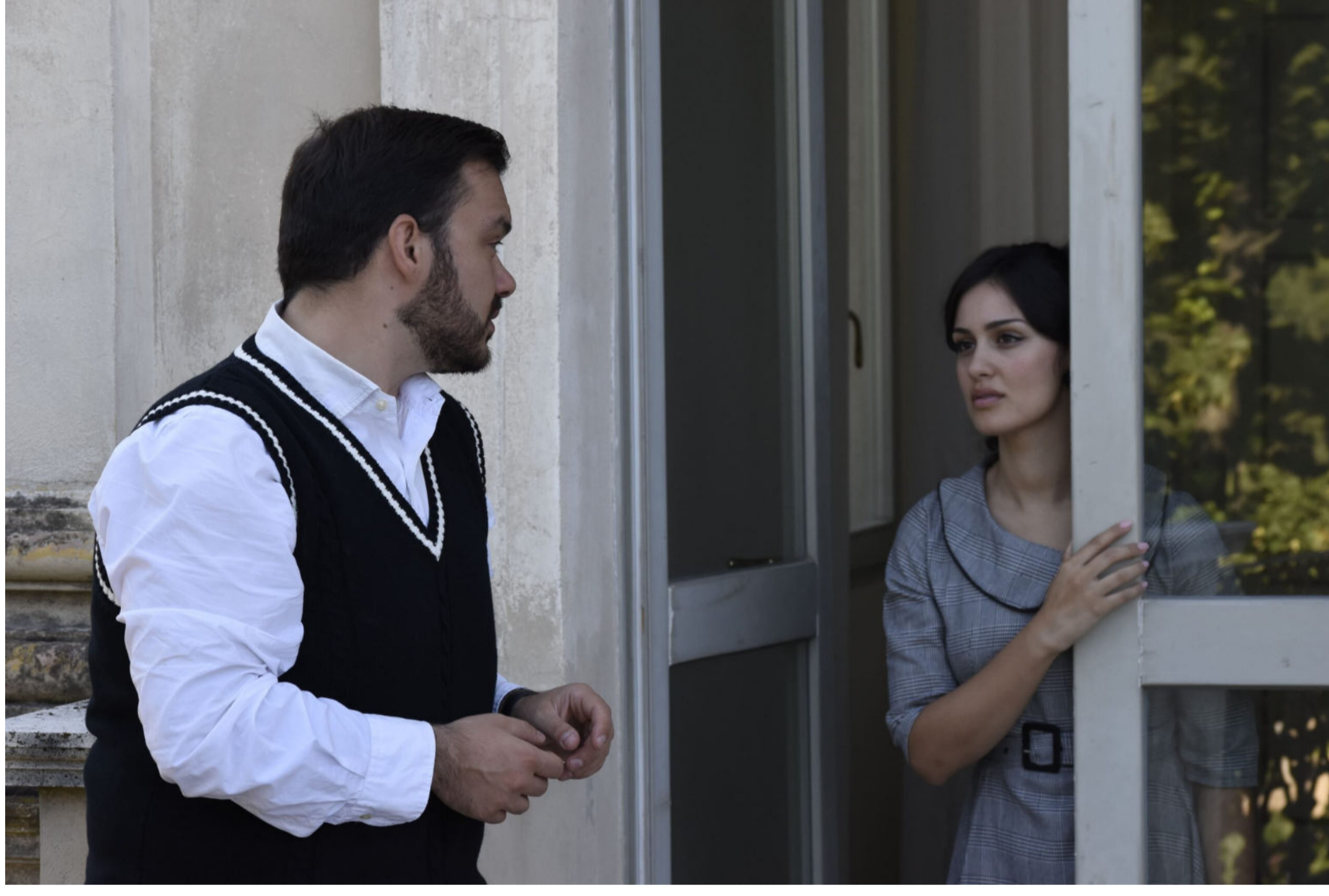
I due timidi.

Così, sempre negli anni Cinquanta, dagli Stati Uniti ci spostiamo in Italia con I due timidi con la musica di Nino Rota su libretto di Suso Cecchi D'Amico. L'atto unico qui segue il filone narrativo della provincia tipico della commedia nostrana che, sempre in movimento, alterna il canto alla recitazione, lasciando accanto alla risata la nostalgia di qualcosa che non potrà essere: i due, Mariuccia e Raimondo, infatti, non riusciranno mai ad esprimersi amore.